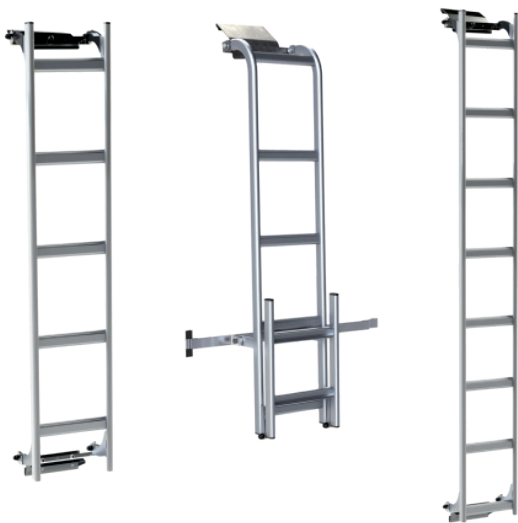
Compatibel met vaste MTS-ladders